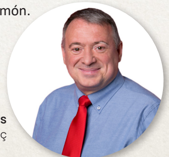
Joan Sans Freixas Alcalde de l'Arboç